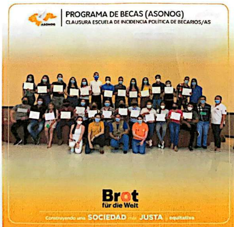
Jóvenes participando en la Clausura de la Escuela de Incidencia Política para Becarios del Programa de Becas de PPM.

Y desde allí nace esto del estudio: "yo me cuestionaba, por qué yo no me preparé antes para ayudar de mejor manera a mi familia, de otra forma. Y es cuando yo digo, voy a estudiar Derecho. Y porqué Derecho, porque quiero defender a las mujeres, a las viejas. Se me entró eso y dije voy a ver de qué forma apoyo a las mujeres. Es eso que tenemos que llevar a la población, del porqué se lucha por los derechos de las mujeres, no porque la mujer quiere mandar al hombre, no. Es por una igualdad".