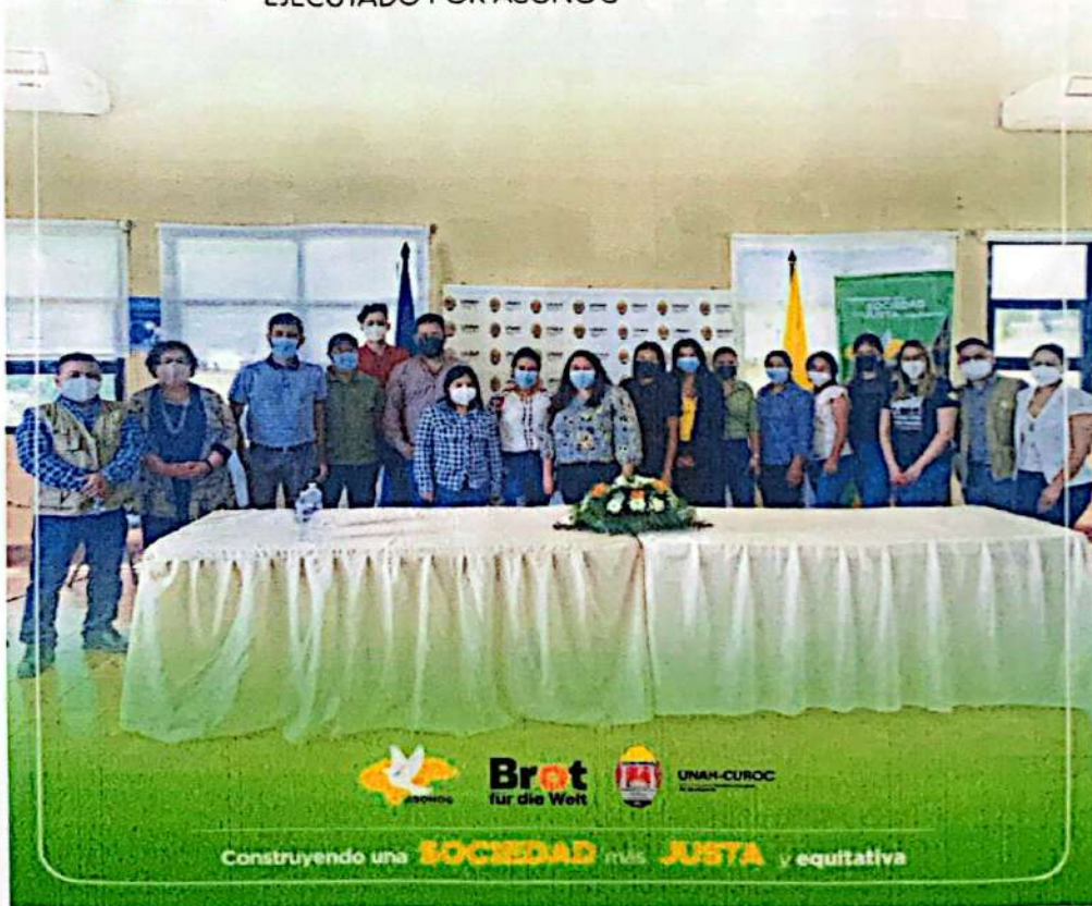
Foro "Cultivando Esperanza para Jóvenes", en el marco del Fondo de Becas de Pan Para el Mundo, "acercando a los jóvenes a la academia".