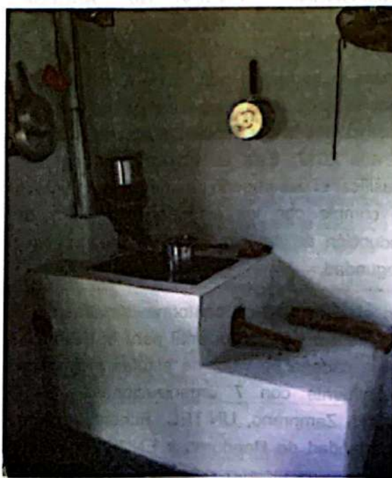
Estufa mejorada fija- modelo Justa

de 500,000 estufas mejoradas instaladas a nivel nacional. Por medio de uno de los estudios generados por V4CP se logró generar esta estimación, sin embargo, está lejos de ser exacta ya que existe doble contabilidad con algunos actores, debido a que el costo por instalación de cada estufa pudo haber sido compartido hasta por tres implementadores y muchas de estas estufas puede que ya estén en desuso. Esto nos llevó a identificar que deben llevarse a cabo sistemas de monitoreo y reporte, que hagan un conteo más exacto sobre la cantidad de estufas mejoradas que están en uso en el país.