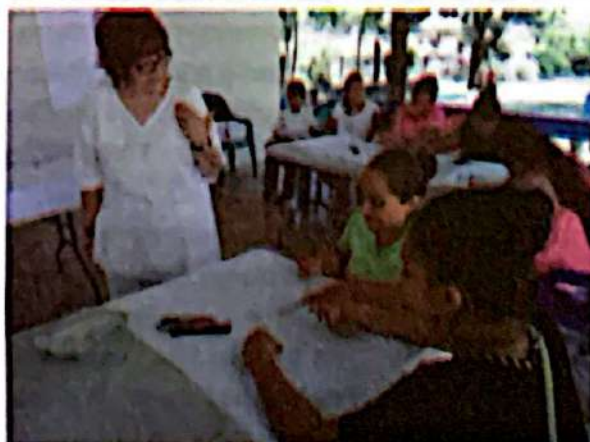
Grupo focal con población usuaria de estufas mejoradas

Fundación Vida y HdH brindaron seguimiento en campo durante el levantamiento de información y desarrollo de los estudios. Esto permitió que se empoderaran sobre la evidencia recolectada, al mismo tiempo guiar a los equipos consultores y servir como un control a la calidad y desarrollo de los estudios. Esto, además, permitía establecer confianza entre los entrevistadores y las personas consultadas. También apoyaron técnicamente en revisiones preliminares de los estudios, apoyo en levantamiento de encuestas, entrevistas, solicitud de información a instituciones, facilitación de información, preparación de talleres con la PIEM+, grupos focales con población usuaria de estufas mejoradas y coordinación de reuniones del comité de seguimiento. A nivel administrativo, se contribuyó en la revisión de acuerdos según TdRs, propuestas técnicas y contratación,