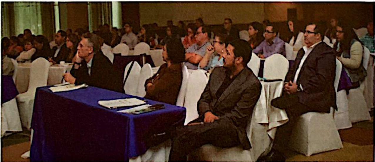
Desafíos en el acceso a energía y sus implicaciones en la seguridad alimentaria

Por otro lado, para todos los estudios se generaron resúmenes ejecutivos y se desarrollaron dos cartillas como versiones populares, una para el marco jurídico y la otra para el estudio de enfoque de género, brochures, afiches, spots radiales, videos de la ENAEM, siendo instrumentos han facilitado que la información se comparta en varios espacios y llegue a usuarios y organizaciones locales que trabajan con estufas mejoradas, como fue en un evento de capacitación y socialización de estos productos con radios comunitarias del occidente del país.