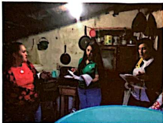
Acompañamiento durante aplicación de encuestas para estudio de variables de adopción de EM- Anexo ENAEM

tramitación de pagos y cierres de contratos. Todo lo anterior fue posible debido a que las OSC contaban con enlaces técnicos que facilitaron la ejecución de estas actividades.