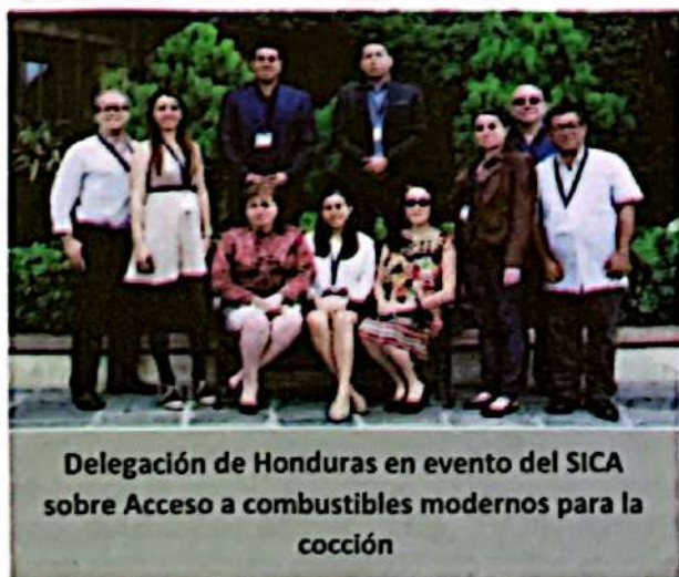
Delegación de Honduras en evento del SICA sobre Acceso a combustibles modernos para la cocción

Un evento relevante en el 2019 fue la contribución de la Plataforma Interinstitucional en la Reunión Centroamericana de Expertos en la Universalización de Acceso a Combustibles Modernos para Cocción en los países del SICA al cual se acompañó como brazo técnico a las secretarías de Estado para realizar la presentación de país en los avances en el uso de estufas mejoradas y la reducción del uso de leña. Para preparar la presentación se hizo uso de los estudios generados por el programa V4CP en ese momento, así como con la información que contaba cada una de las instituciones. Fue un trabajo coordinado y complementario entre instituciones gubernamentales, cooperación internacional y sociedad civil, que permitió mostrar que Honduras estaba trabajando coordinadamente en esfuerzos nacionales para la reducción del consumo de leña