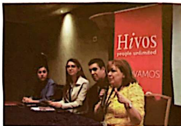
Presentación de Honduras sobre avances en la reducción del uso de leña, facilitada por representantes de: ICF, SEN, SESAL y la PIEM+ en evento del SICA

Por otro lado, en el mismo año se llevó a cabo un evento de Socialización con alcaldías y cooperativas agroforestales del Estudio "Provisión y comercialización de prototipos de leña para estufas mejoradas", evento desarrollado con la colaboración del Departamento de Forestaría Comunitaria del ICF y en las instalaciones de MiAmbiente+. El ICF como autoridad nacional en el manejo del bosque y aliado en el tema es un vehículo para trabajar de forma coordinada con cooperativas agroforestales y apoyarles en generación de negocios verdes entre estos sistemas agroforestales, cultivos energéticos o aprovechar subproductos del bosque como leña. Esto ayudaría como alternativas sostenibles en la obtención de la leña. Muchos de los participantes desconocían que existían diferentes modelos de estufas mejoradas y cómo estas funcionaban para ahorrar leña, las mismas se tuvieron en exhibición donde se preparó el almuerzo, siendo un atractivo más del evento.