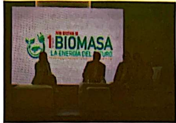
Participación en el Primer Foro de Biomasa

nacionales que se desarrollen para generación de biomasa.