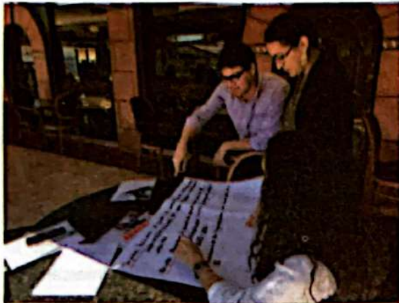
Taller de inducción presencial- febrero 2020

En dicho taller se realizó un ejercicio para identificar el objeto de la sistematización, preguntándonos ¿Qué experiencia queremos sistematizar?