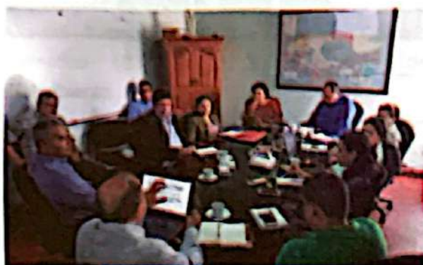
Reunión participativos de la PI para revisión de metodología e instrumentos de investigación para el estudio de exoneración de impuestos

plataforma quienes aportaban para tomar la mejor decisión. Se elaboraba y firmaba un acta de resolución para la contratación del equipo con mayor valoración según el formato establecido por el comité de seguimiento. Las propuestas se valoraron de forma imparcial y transparente, revisando si las mismas cumplían con los objetivos, alcance, metodología y cronograma de actividades claros y realistas, al mismo tiempo valorando los perfiles profesionales según su experiencia general y específica en el cumplimiento de los TDRs. Se seleccionaban los equipos consultores más calificados para la generación de los productos y que pudieran dar fe de la calidad de estos. Muchos de los consultores seleccionados, a pesar de haber concluido con la generación de los estudios, continúan participando en la Plataforma Interinstitucional, lo que permite dar seguimiento a las iniciativas sobre experiencias en estudios previos.