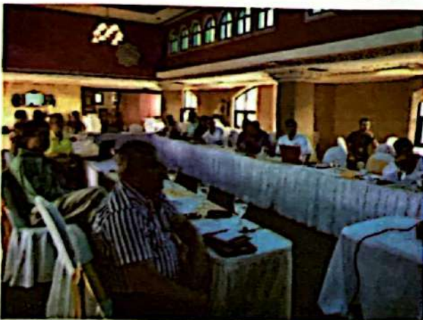
Taller de validación de estudio de enfoque de género en la cadena de valor de estufas mejoradas

observaciones fueron incorporadas y al mismo tiempo pudieran hacer comentarios finales para que fueran agregados en los estudios. La mayoría de los actores de la PIEM+ validaron los estudios considerándolos actualizados y de alta calidad para ser utilizados como referentes en la temática. Fue muy importante el involucramiento que tenían los actores de gobierno ya que se empoderaban sobre los resultados de estos y consideraban a la PIEM+ como un apoyo técnico para el gobierno. La información generada por los estudios permitió aclarar en mayor medida elementos de contexto para los futuros esfuerzos nacionales sobre la temática. Esto permitió que las OSC como la PIEM+ fueran referentes temáticos y facilitadores de estudios científicos.