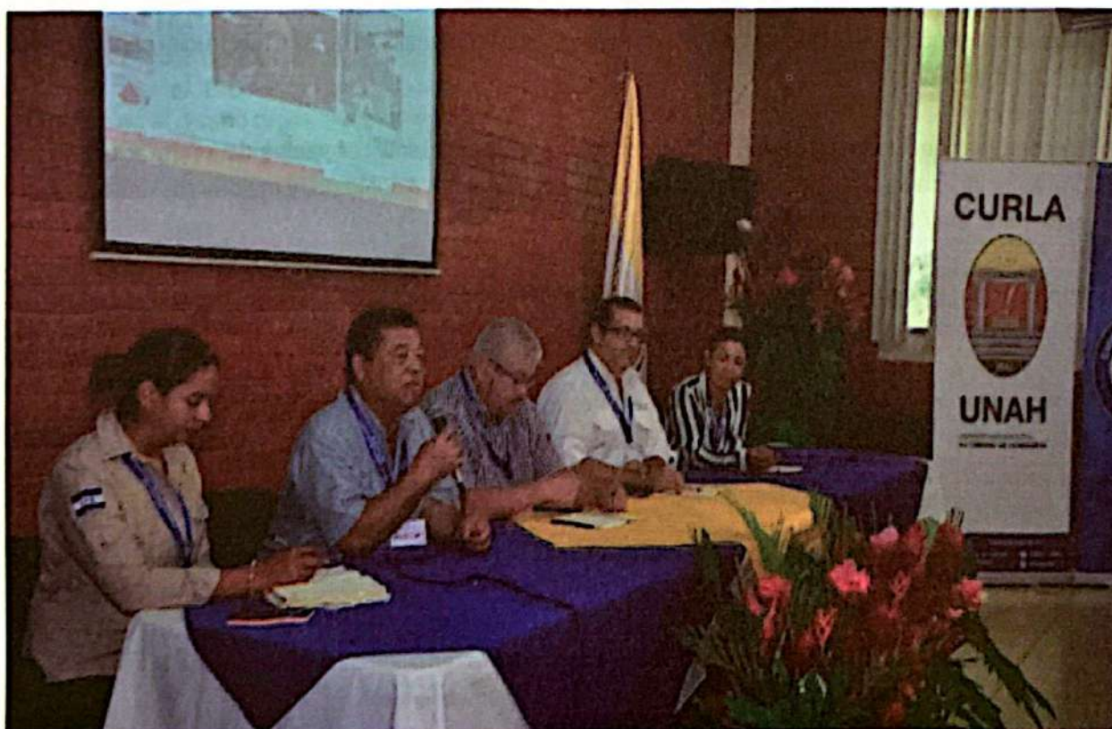
Simposio de Estufas Mejoradas y Biomasa