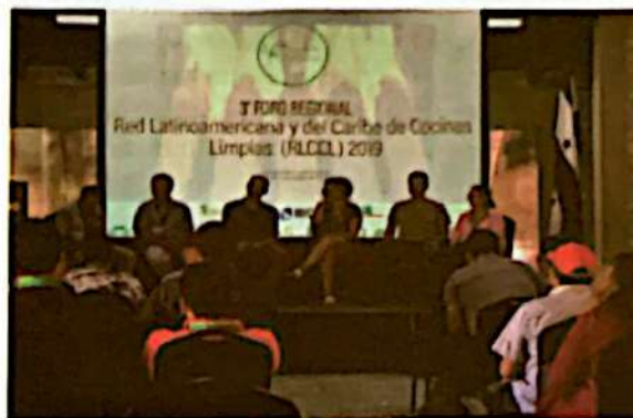
Participación en el 3er Foro regional RLCC

relación con la Secretaría de Salud, CESCO y la Universidad Pedagógica.