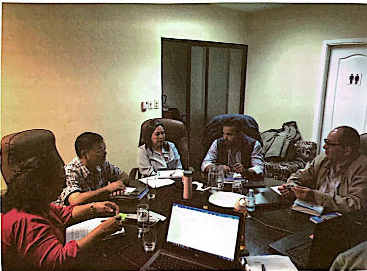
Reunión de discusión y trabajo de la PIEM+