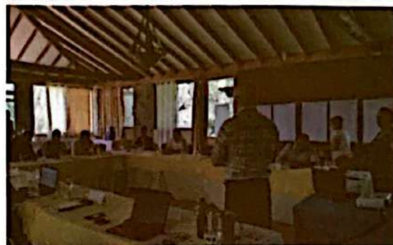
Taller de construcción participativa durante Estudio de Diagnóstico Socioeconómico y Ambiental para una ENAEM

seguimiento de los impactos como ejecutores de acciones en la cadena de valor de estufas mejoradas y otras.