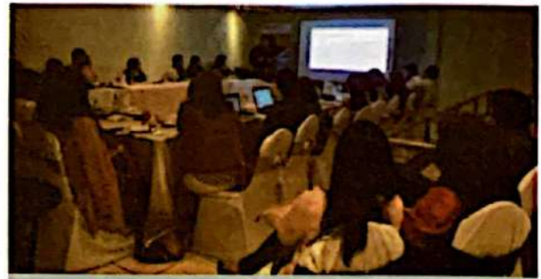
Presentación de avances de la ENAEM

La construcción de la ENAEM fue como otro estudio, siguió todas las pautas de construcción establecidas por el programa V4CP. Eso sí, con mayores esfuerzos de validación, revisión y socialización por su importancia. Contó con un acompañamiento asesoría legal permanente y la constante retroalimentación de la DNCC de MiAmbiente. La ENAEM se enriqueció con levantamiento de información en campo para conocer variables de adopción de EM y entrevistas a actores clave miembros y no miembros de la PIEM+.