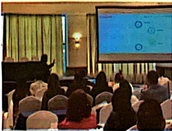
Evento "Desafíos en el acceso a energía y sus implicaciones en la SAN"

Evento: "Desafíos en el acceso a energía y sus implicaciones en la seguridad alimentaria" fue un evento desarrollado para lanzar la construcción de la Estrategia Nacional de Estufas Mejoradas y posicionarla como una necesidad en las políticas públicas nacionales para el acceso a energía en los hogares. Dicho evento organizado por V4CP y la DNCC, logró la representatividad de múltiples actores involucrados para que conocieran el alcance y brindaran insumos para la Estrategia Nacional para la adopción de estufas mejoradas (ENAEM). Con este evento se hizo público los esfuerzos de coordinación para la construcción de la ENAEM. Se contó con la participación de distintos actores nacionales relacionados al tema y la cobertura de medios de comunicación.