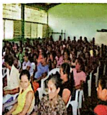
Asamblea municipal para elegir la Red de Mujeres en Virginia