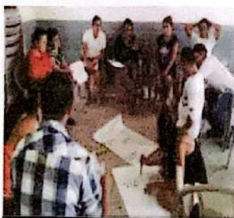
Jornadas de construcción del PMP en la Virtud

Esta fase se centró en realizar las acciones que permitían la elaboración del Presupuesto de forma participativa e incluyente. El Equipo Gestor coordinaba y lideraban los encuentros y las jornadas de trabajo.