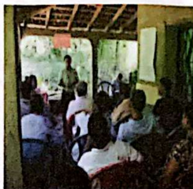
Asamblea comunitaria en construcción del P.M.P. el Coyolar, Virginia Lempira.

El Equipo Gestor recopiló la información y a través de las jornadas y en reunión con la corporación municipal se fueron incorporando las necesidades y actualizando el Plan de Desarrollo Municipal (PDM-OT)