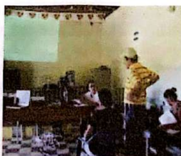
Jornadas de construcción del PMP en la Virginia