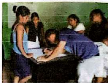
Capacitación sobre Incidencia Política con las Coordinadoras de Sociedad Civil

"Este momento fue importante ya que poco a poco se generaron las condiciones de confianza y relacionamiento entre las organizaciones involucradas y las autoridades"