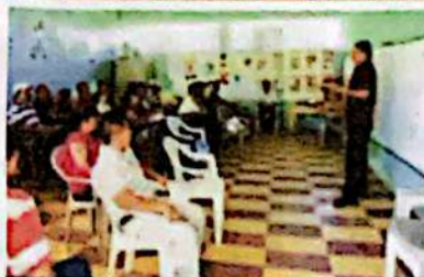
Alcalde de Virginia participando en la presentación de propuestas para el P. M. P.

La Red de Mujeres construyó su agenda estratégica a nivel municipal donde las mujeres en coordinación con la OMM a través de reuniones priorizaron las áreas de trabajo en Salud, Educación, Participación Política, Economía y Ambiente. La Red de Jóvenes construyó una visión estratégica que toma en cuenta los aspectos de organización, capacitación, iniciativas