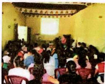
Socialización del PMP en Virginia

El Equipo Gestor en reuniones de corporación municipal presentó el Presupuesto Municipal para su revisión, modificación y aprobación final, tomando siempre en cuenta los criterios de evaluación y priorización: que los proyectos sean priorizados por la comunidad o por la organización, que fuera una necesidad que beneficiara a la mayoría, que tenga una respuesta del Gobierno Local, que beneficie a los jóvenes y grupos de mujeres.