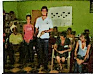
Jóvenes participaban en jornadas priorización en Mapulaca

“En muchos casos se encontró que muchas comunidades tenían proyectos que no eran sus necesidades, con esta actividad las organizaciones han priorizado sus necesidades actuales”