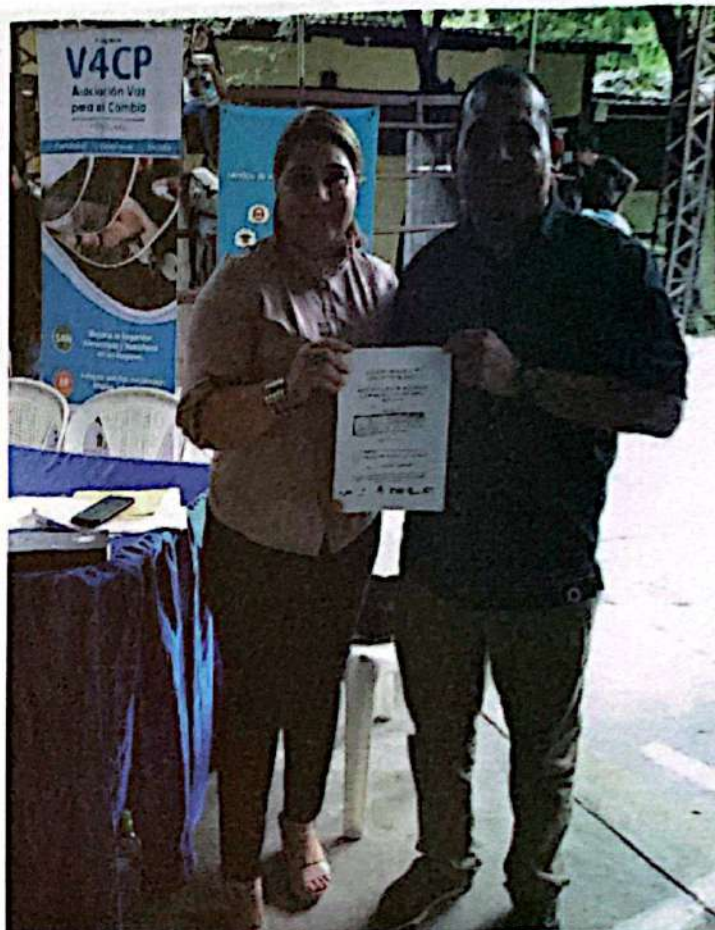
Cabildo abierto donde se aprobó la Política Municipal de Seguridad Alimentaria y Nutricional con Enfoque de Cambio Climático.