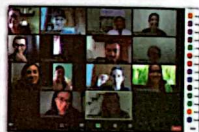
Momento 5 Elaboración del Informe de la Sistematización de Experiencias

Un momento determinante fue la consulta a los actores claves de la Mesa Municipal SAN, mediante la realización de un grupo focal virtual, donde se aplicó una herramienta encaminada a recolectar información y reflexionar sobre ella, en relación al contexto previo a la experiencia, nuestros aportes institucionales, las fortalezas y debilidades en el acompañamiento, los momentos más importantes, principales logros,