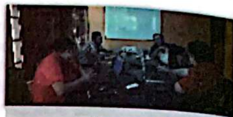
Momento 2 Definición del eje, objeto y objetivo de la experiencia a sistematizar