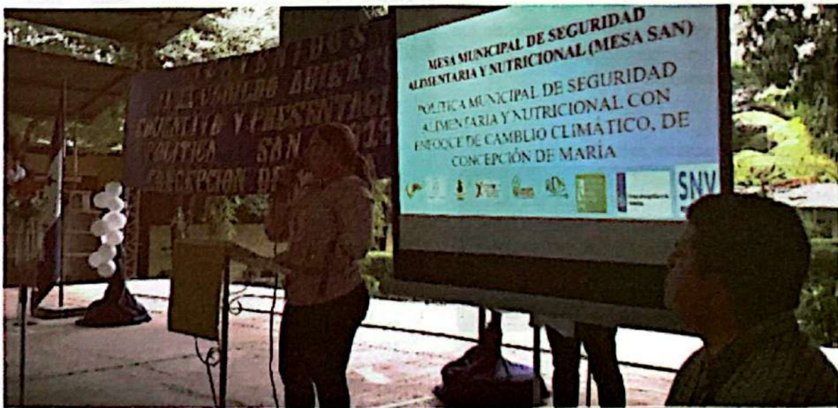
Cabildo abierto donde se aprobó la Política Municipal de Seguridad Alimentaria y Nutricional con Enfoque de Cambio Climático.

Asesoramos a la MMSAN con relación a la agenda y metodología para celebrar el cabildo abierto. En primer lugar, se acordó compartir los gastos de alimentación del evento con la alcaldía, ya que, se esperaba la participación de unas 350 personas. Se expresó que en el cabildo realizaríamos una exposición magistral de la Política.