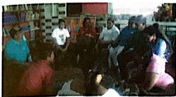
Taller "Diseño Estrategia de Incidencia MMSAN"

A continuación, se presentan los lineamientos estratégicos de la PyENSAN: