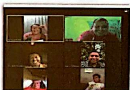
Momento 4 Espacios de consulta con Mesa SAN