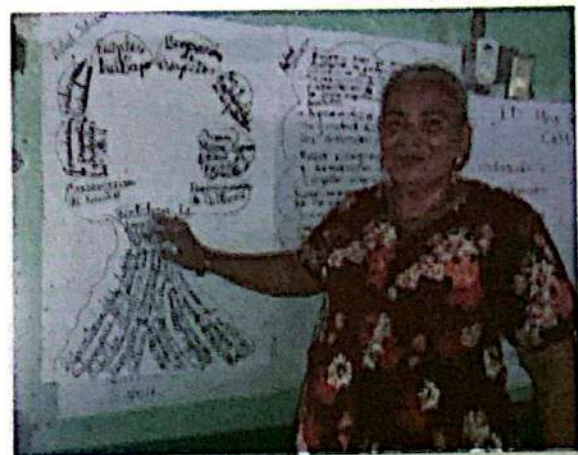
Regidora Municipal participando en el taller de análisis situación SAN.

El analizar la situación SAN en el municipio, permitió que, mediante las metodologías de Árbol del Problema y Árbol de Soluciones, diera claridad a los y las participantes en relación con las funciones de la MMSAN y establecer como meta, lograr la aprobación de la Política Municipal SAN-CC.