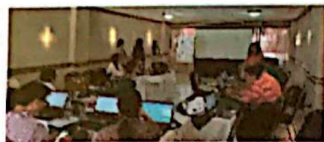
Momento 1 Conceptualización de la sistematización de experiencias

Se ordenó el proceso en sus diferentes momentos y actividades que llevaron a la aprobación de la Política Municipal de Seguridad Alimentaria y Nutricional con Enfoque de Cambio Climático.