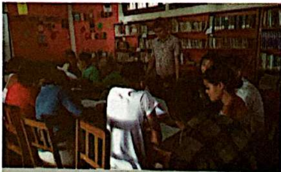
Taller de revisión y ajustes al borrador de Propuesta de Política Municipal SAN-CC

Es importante mencionar, que dentro de los lineamientos de la PyENSAN 2019-2030, se enmarcan los componentes, proyectos y acciones, contenidos en la Política Municipal de Seguridad Alimentaria y Nutricional, de Concepción de María.