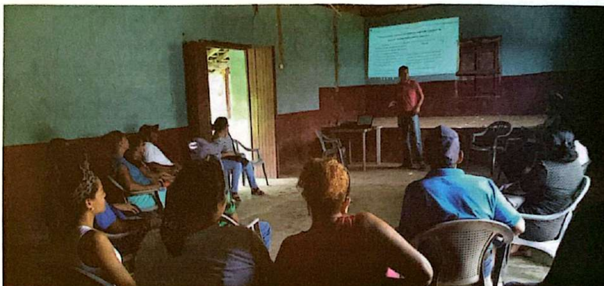
Socialización de la Política Municipal SAN-CC en el sector de San Benito

Una vez realizados los foros/asambleas de socialización comunitaria del borrador de la Propuesta de Política Municipal SAN-CC, es importante mencionar que, en todos los sectores, los/as líderes/as participantes expresaron estar de acuerdo con su contenido. Solo preguntaban algunos conceptos como política y SAN, los cuales, fuimos aclarando oportunamente.