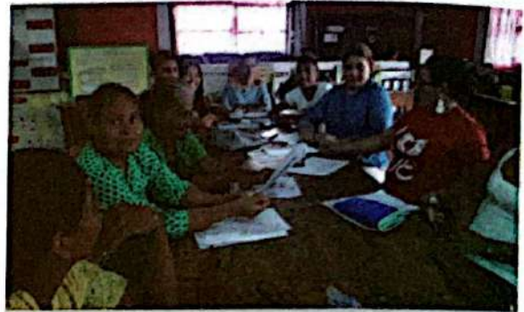
Taller de revisión y ajustes al borrador de Propuesta de Política Municipal SAN-CC

De forma específica, la presente Política Municipal de Seguridad Alimentaria y Nutricional, de Concepción de María, se ha enmarcado dentro de los Lineamientos: 2, 3, 7, 8, 9 y 10 , de la PyENSAN, en vista del contexto actual del municipio, y de las condiciones del gobierno local para la inversión y coordinación en el marco de la Política Municipal.