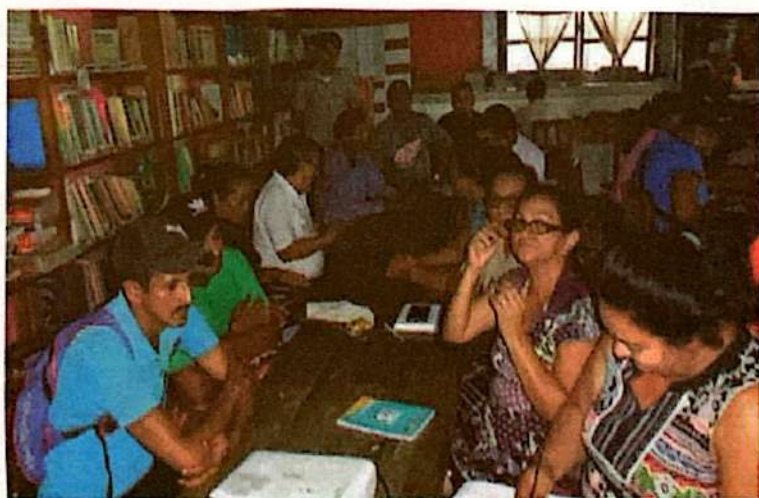
Socialización de la Política Municipal SAN-CC en el sector CdM Centro.

Una vez realizados los foros/asambleas de socialización comunitaria del borrador de la Propuesta de Política Municipal SAN-CC, es importante mencionar que, en todos los sectores, los/as líderes/as participantes expresaron estar de acuerdo con su contenido. Solo preguntaban algunos conceptos como política y SAN, los cuales, fuimos aclarando oportunamente.