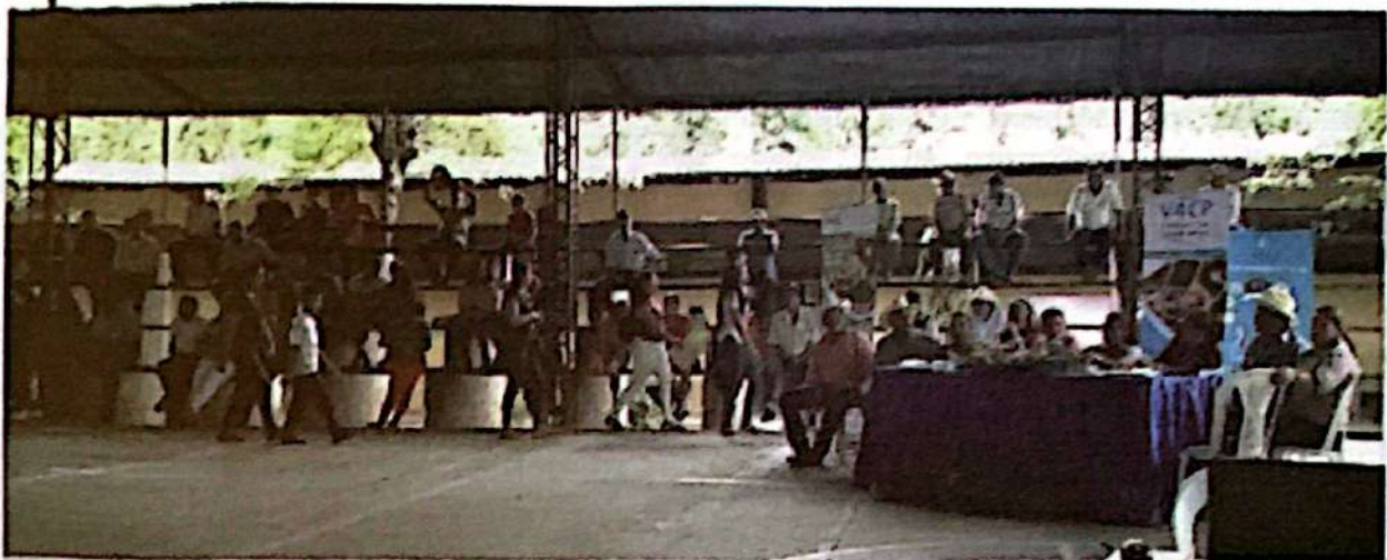
Cabildo abierto donde se aprobó la Política Municipal de Seguridad Alimentaria y Nutricional con Enfoque de Cambio Climático.

Asesoramos a la MMSAN con relación a la agenda y metodología para celebrar el cabildo abierto. En primer lugar, se acordó compartir los gastos de alimentación del evento con la alcaldía, ya que, se esperaba la participación de unas 350 personas. Se expresó que en el cabildo realizaríamos una exposición magistral de la Política.